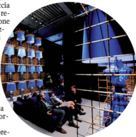
Rho-Pero Un padiglione del Salone del Mobile alla fiera di Milano